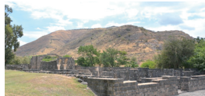
今天對於格拉森(Gerasenes)這地方究竟在哪，仍富爭論。一個說法指那是約旦的Umm Qais，另一個說法則是以色列的庫爾西(Kursi)。後者就在加利利海的東邊，現於其中找到一處屬五世紀的拜占庭修道院遺跡。